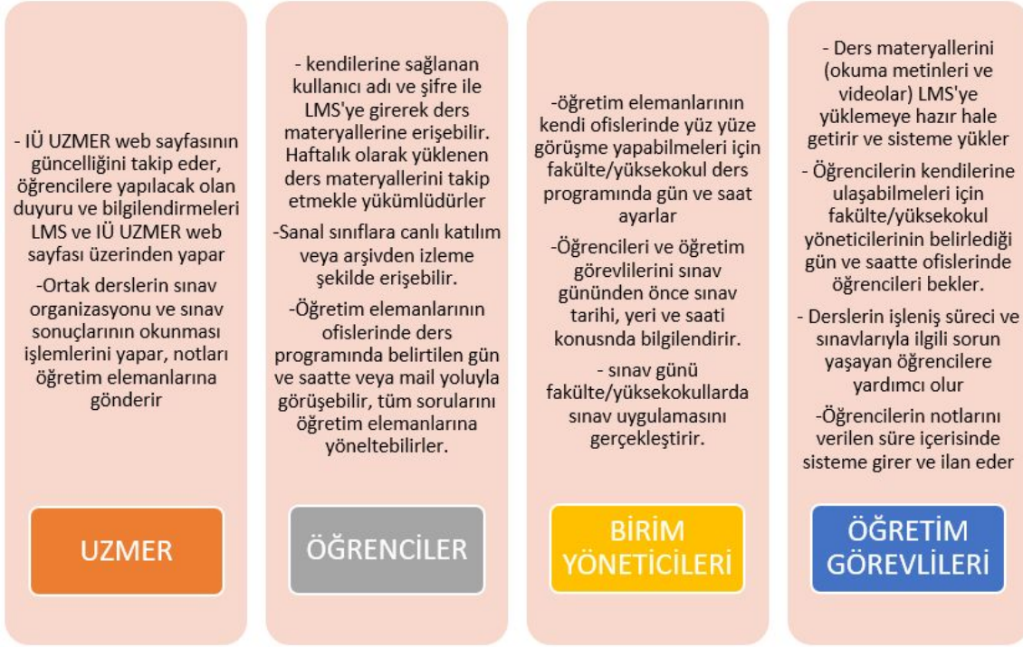
Şekil 3: Görev ve Sorumluluklar