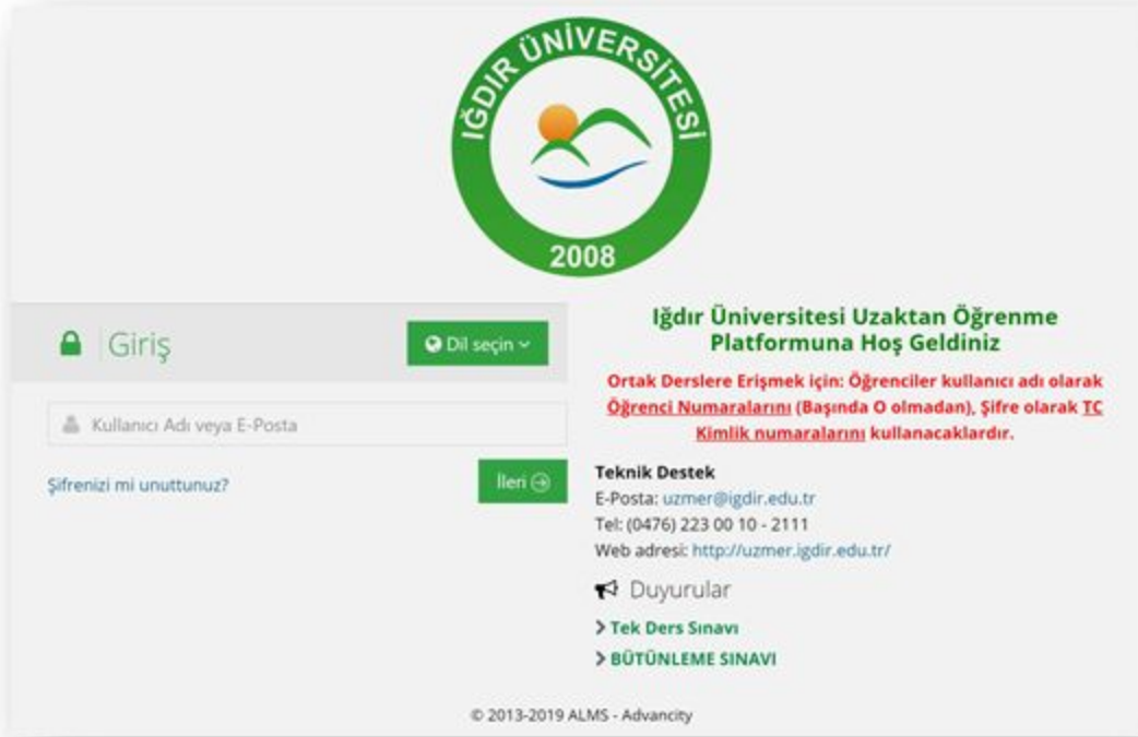
Şekil 1: LMS Giriş Ekranı

ye giriş yapan öğrencilerin, bu sistemi etkili bir şekilde kullanabilmeleri için görsellerle desteklenen bir kullanım kılavuzu hazırlanmıştır.