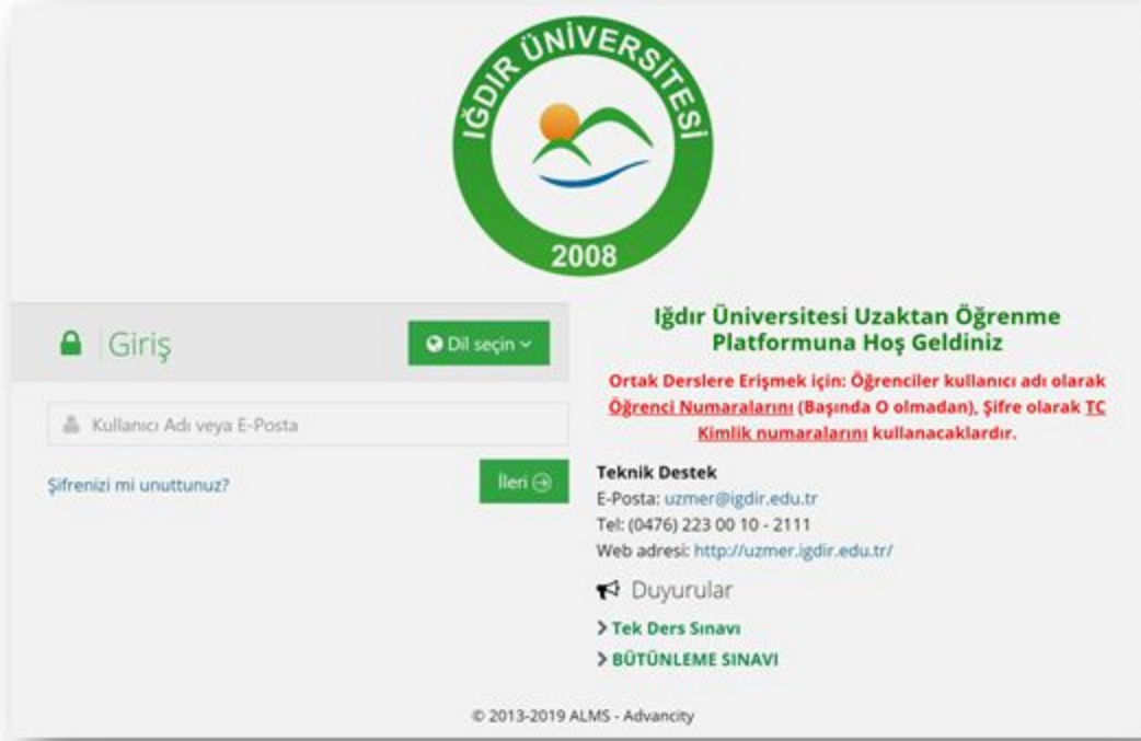
Şekil 1: LMS Giriş Ekranı