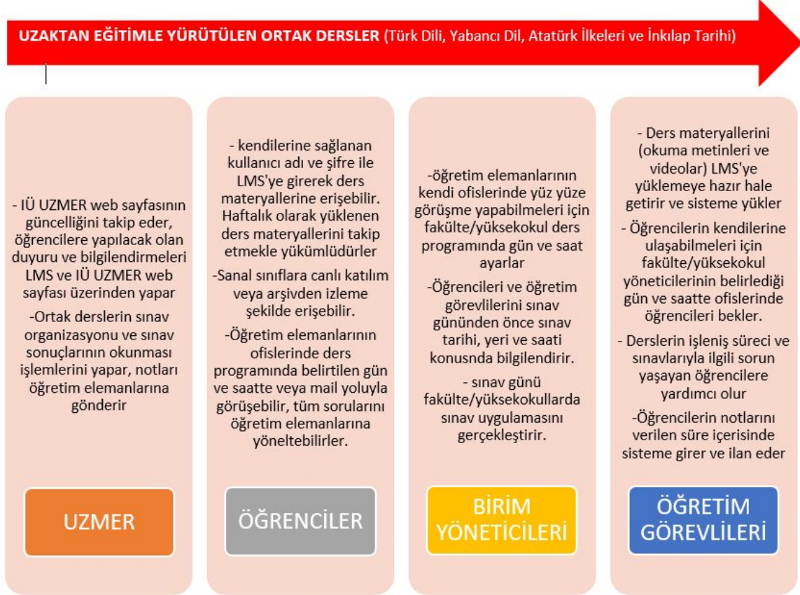
Şekil 3: Görev ve Sorumluluklar

Uzaktan eğitimle yürütülen ortak derslerin ders işleniş yapısı ve bu sistemde yer alan kişi ve yöneticilerin görev ve sorumlulukları aşağıda şematize edilmiştir.